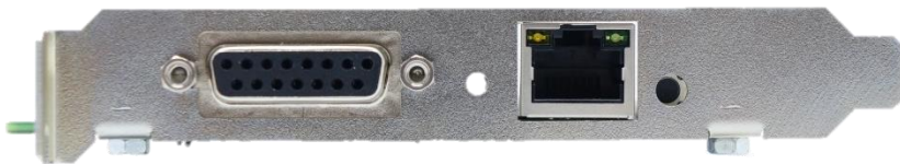
Рисунок 2.3 - Вид со стороны задней панели

Внешний вид со стороны передней панели показан на рисунке 2.3